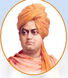
१२ जन्युआरी स्वामी विवेकानंद जयंती