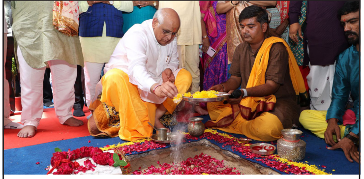
બહુચરાજી માતાજીના મંદિરના રૂપિયા ૭૬.૫૧ કરોડના ખર્ચે મંદિરનું પુનઃનિર્માણની પ્રથમ ફેઝની કામગીરીનું મુખ્યમંત્રી શ્રી ભૂપેન્દ્રભાઈ પટેલના વરદ હસ્તે ખાતમુહૂર્ત કરવામાં આવ્યું

જળશક્તિ મંત્રાલય અંતર્ગત આગામી સમયમાં યોજનાર કાર્યક્રમો અંગે માહિતી આપતાં શ્રી સી.આર. પાટીલે જણાવ્યું કે વડાપ્રધાનશ્રી નરેન્દ્રભાઈ મોદીના માર્ગદર્શનમાં "કેચ ધ રેન" કાર્યક્રમ અંતર્ગત ખૂબ